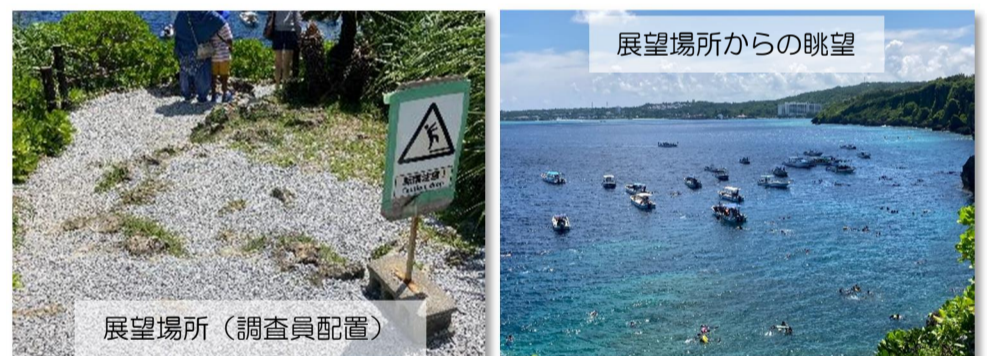
図 1-3 状況写真例