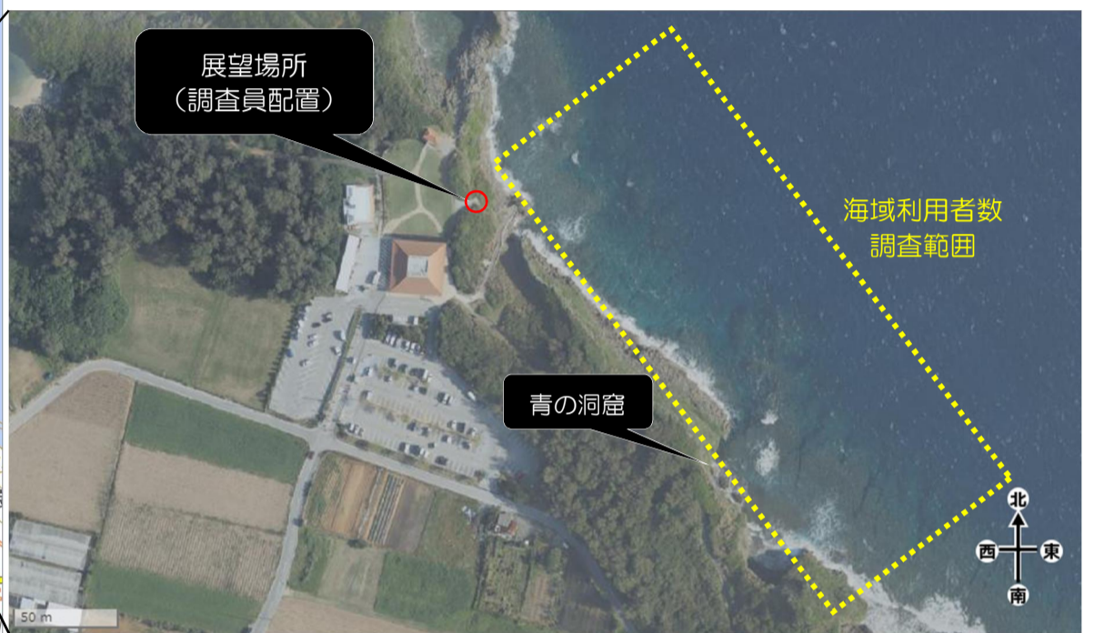
図 1-2 調査地点詳細図